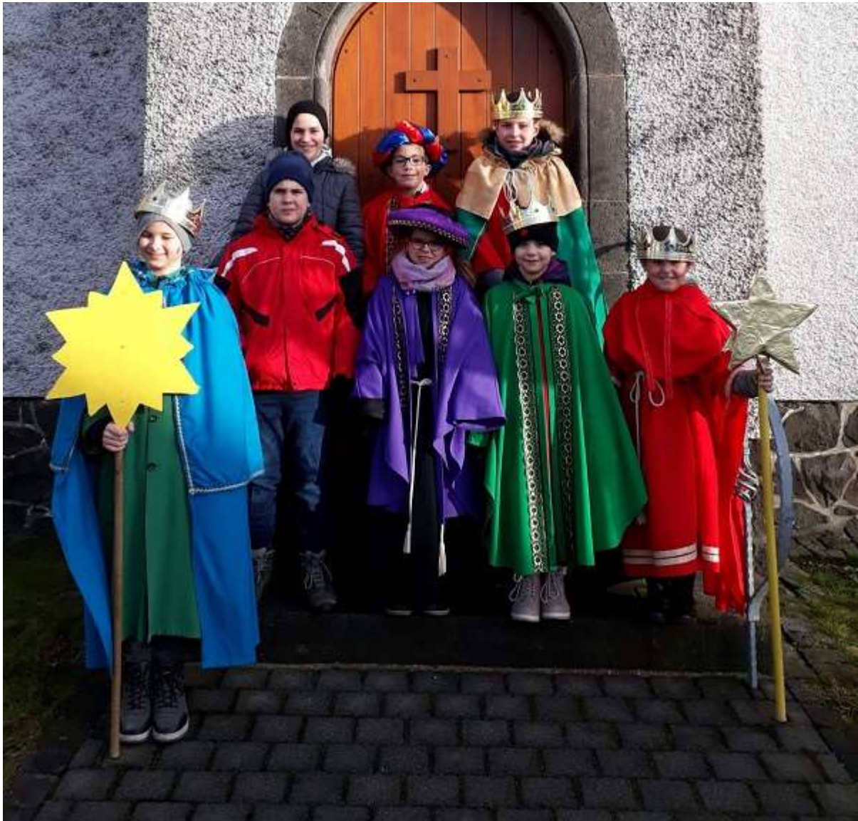
KURZWEILIGES PROGRAMM BEIM SENIORENTAG IN ANSCHAU

geöffnet wurden und ihre Aktion Anerkennung finden konnte. Natürlich danken wir an dieser Stelle besonders den Kindern selbst und allen Helfern, die durch ihr Mitwirken den schönen Brauch unterstützt haben. Es ist sicherlich immer wieder schön anzusehen, wenn in dieser Winterzeit die Sternsinger mit ihren bunten Kleidern in den Straßen unterwegs sind. Vergessen wir bei dieser Gelegenheit aber nicht den eigentlichen Zweck, der hinter dieser Aktion steckt. Es kommt schließlich ein beträchtlicher Geldbetrag zustande, der dringend für Caritative Zwecke seine Verwendung findet. Vielen Dank also den Kindern und allen Helfern.