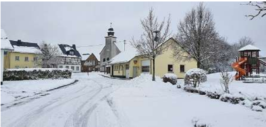
Blick durch Ägidiusbrunnen auf die Ägidiuskapelle